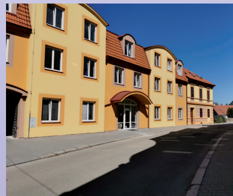
PRO ZAMĚSTNANCE. V říjnu loňského roku byl zkoládován bytový dům pro zaměstnance.

Nedílnou součástí filosofie soběslavské společnosti Banes je sport. Společnost podporuje více než 20 sportovních klubů, většinou z okolí, které mají značku firmy ve svém názvu (Florbal BANES Soběslav, Atletika BANES Pacov, Stolní tenis BANES Soběslav...) a také kulturní a sociální projekty.